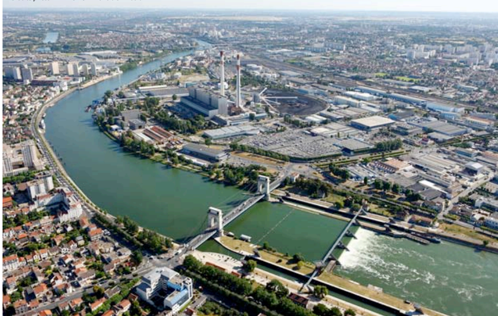
Le secteur des Ardoines Vitry-sur-Seine