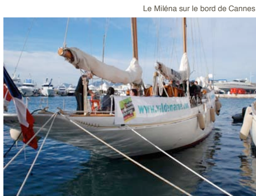
Le Miléna sur le bord de Cannes

Grâce à ses nombreuses actions annuelles à destination des investisseurs espagnols, italiens ou encore chinois, le Val-de-Marne accueillera de nombreux investisseurs étrangers.