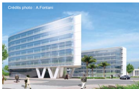
L'immeuble Miami à Rungis : siège social de Ricoh

> Ricoh , leader mondial des photocopieurs d'entreprises et du matériel bureautique numérique, a installé son siège social dans un bâtiment de 20 000 m 2 , au sein de la zone d'activités SILIC à Rungis.